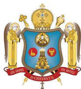
Stema Episcopiei Ortodoxe Române a Maramureșului și Sătmăreșului