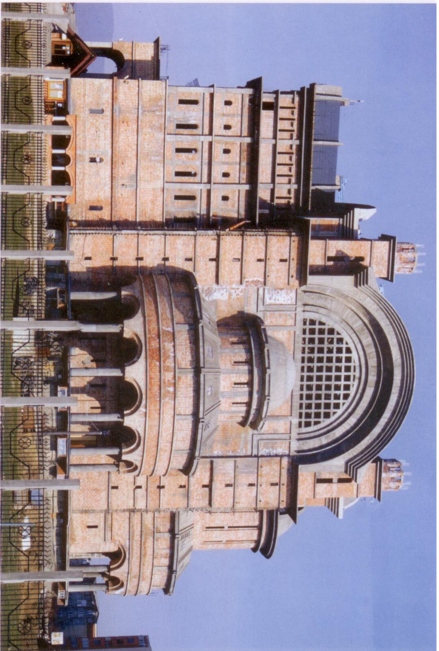
Catedrala Episcopală “Sfânta Treime” din Baia Mare